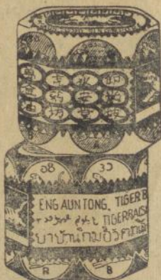
Dalem goetji ketjil merah dan poeti

Obat tjap Matjan tida boleh tida ada di toean poenja roemah, kerna tida ada obat lebih baek boeat semboehken. Rheumatiek, sakit boekoe toelang dan spier, kasaleo dan pilek dari pada ini obat oemoem. Djoega boeat laen-laen penjakit dan ganggoean obat tjap Matjan ada mandjoer. Tjoba soeroe toean poenja boedjang beli boeat satalen satoe goetji ketjil Obat Matjan. Toean pasti aken dapet kafaedahan dari ini.